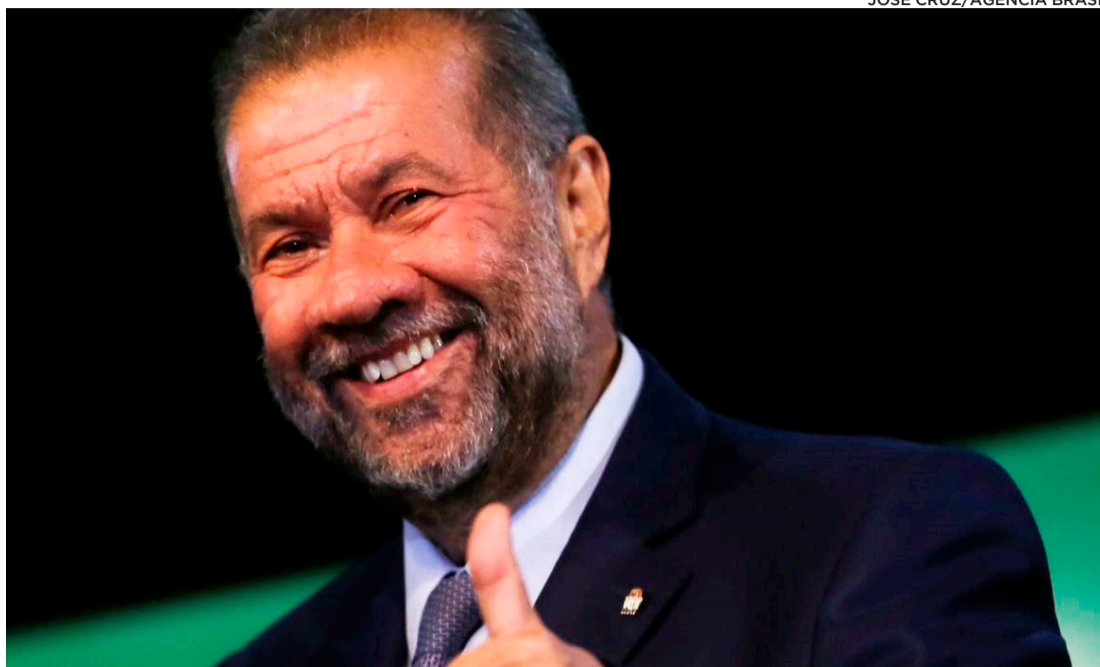
Carlos Lupi anunciou que o mutirão deve começar em três estados do Nordeste, que possuem as maiores filas de perícia médica

Na visita à UGT, o ministro disse que o governo pretende lançar, em março, o cartão de benefícios para o aposentado. A ideia é que esse cartão tenha validade em todo o país e concentre benefícios e direitos dos aposentados como passagens gratuitas no transporte público. “Quero criar um cartão, um QRCode, que vai ter lá, para você poder mostrar em qualquer lugar. Ele poderá estar no celular. Estamos trabalhando para que o Banco do Brasil e a Caixa Econômica emitam para quem é cliente deles. Neles [cartões] vai ter toda a unificação dos benefícios por lei alcançados pelos beneficiários