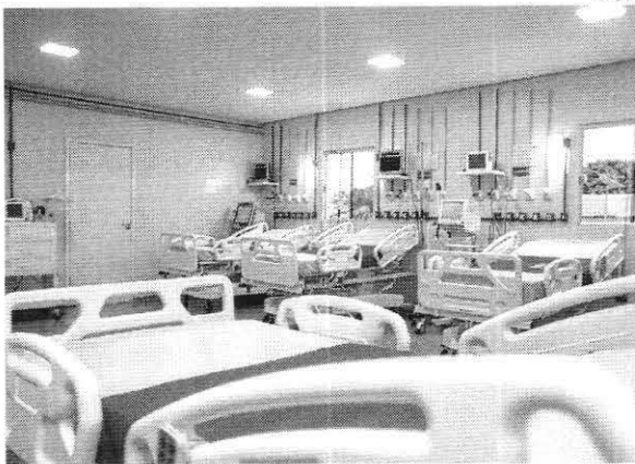
Casos de covid, óbitos em decorrência da doença e ocupação de leitos estão em queda no Maranhão

"Nesta semana, a transmissão da Covid-19 ficou mais baixa em todo o Maranhão. O número de casos continua caindo, semana