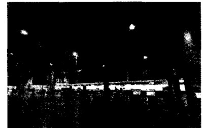
Assinatura do contrato de concessão de aeroporto ainda não ocorreu

Aeroporto Cunha Machado e Aeroporto de Imperatriz serão gerenciados pelo Grupo CCR