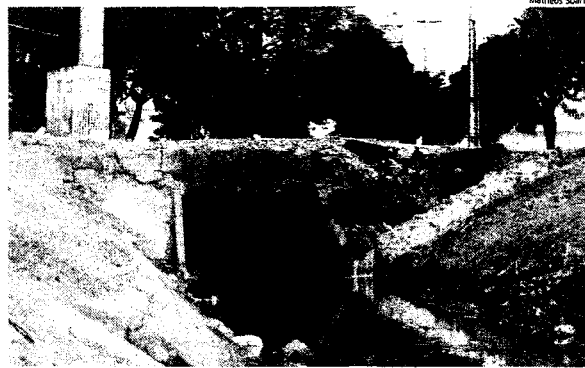
Maranhão avança lentamente na coleta de esgoto e abastecimento de água em residências, nos últimos 15 anos

No caso do acesso à coleta de esgoto o número foi ainda maior, 6,6 milhões de habitantes moram em residências sem coleta de esgoto. Na capital 50,4% da popula-