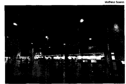
Assinatura do contrato de concessão de aeroporto ainda não ocorreu

Aeroporto Cunha Machado e Aeroporto de Imperatriz serão gerenciados pelo Grupo CCR